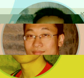
Jing (2011年) (浙江大学)

兴奋的体验从第一个岗位开始，一切都是新鲜的，接触到贴近人们生活方方面面的众多产品，想到我的工作可以让大众的生活更加安全和舒适，每天都有一种成就感。同事们的热心帮助，让我迅速融入了公司的生活。